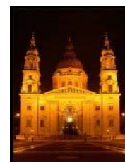
„St Stephen's“ bazilika